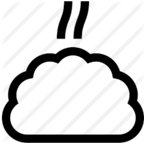
gőzölgő trágya feketében